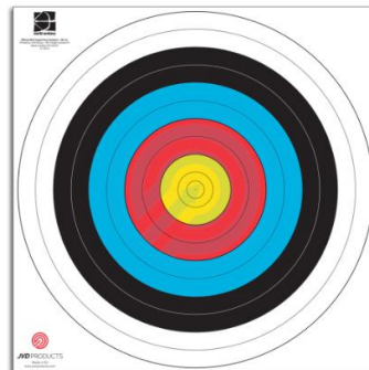
80cm 10 Rings (U12 Recurve)